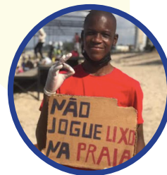
Adler Mucoche Cidade de Maputo